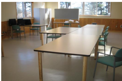
パソコン・作業机・掲示版等