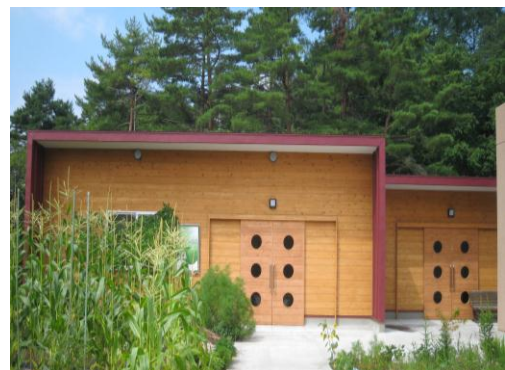
側面には、畑もあり今年は沢山の収穫がありました