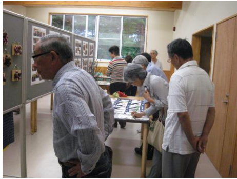
夏祭り当日に日々の作品を展示し 沢山の来客者に見て頂きました