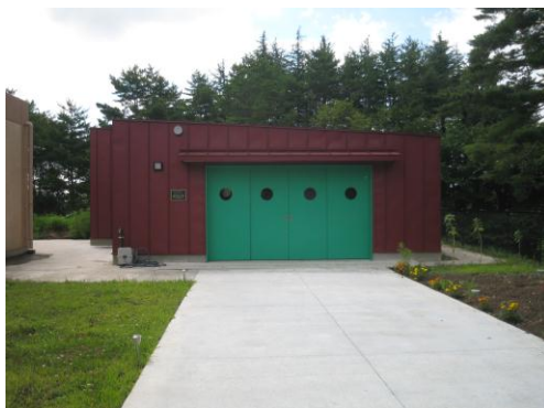
作業所正面からの写真