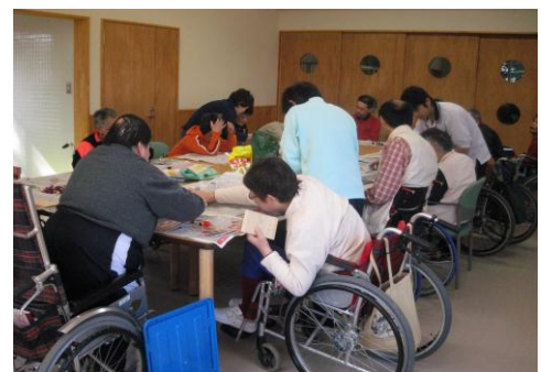
活動風景（壁掛け作り）